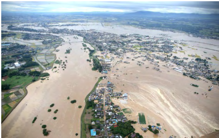
2015年9月10日、堤防が決壊した鬼怒川

全半壊家屋が5千棟以上に広がり、浸水が解消するまでに10日以上かかりました。犠牲者は15人（そのうち災害関連死認定者が12人）と公表されています。