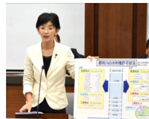
予算特別委員会で質問

県は851億円もの莫大な負担を求められ、完成すれば維持費用も負担しなければなりません。これらは県民が払う水道料金に上乗せされます。